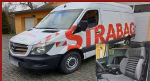
DB Sprinter STRABAG-Stuttgart