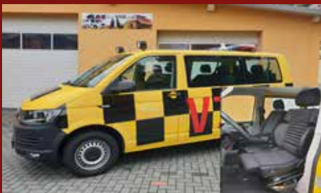
VW T6 FRAPORT FRANKFURT