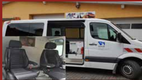
DB Sprinter Wasserschiffahrtsamt Münster