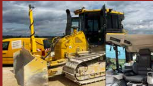
Komatsu Raupe Fa. Leonhardt Weiss