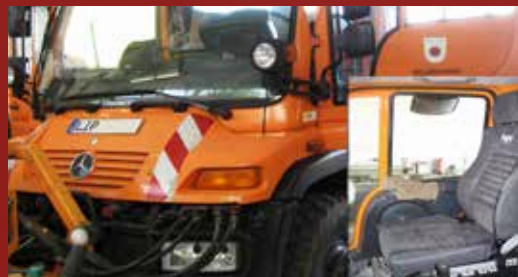
Unimog Kreis Lippe