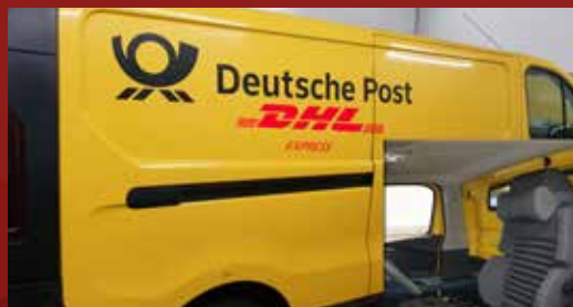
Renault Traffic DHL Deutschland