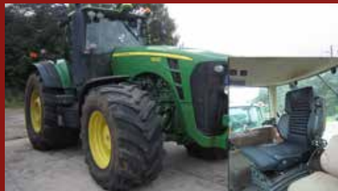
John Deere Traktor