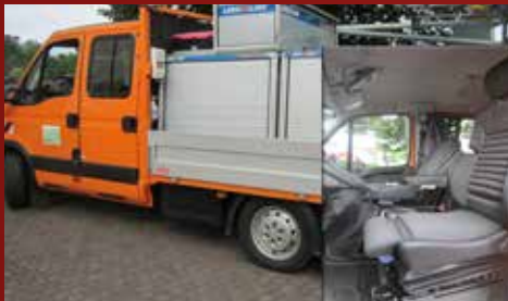
Iveco Dailey Strassen NRW