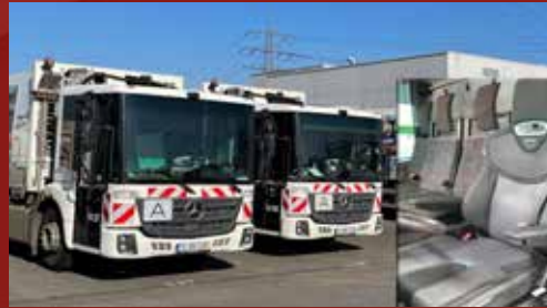
DB ECONIC Entsorgungsbetriebe Essen