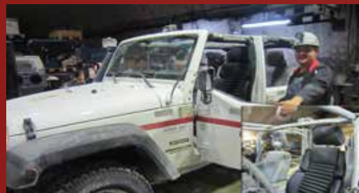
Jeep Wrangler Kali u. Salz Untertagebau