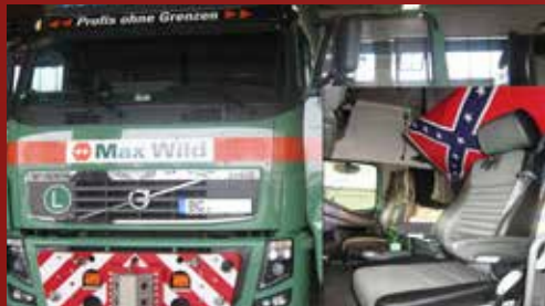
VOLVO FH Max Wild Spezial Transporte