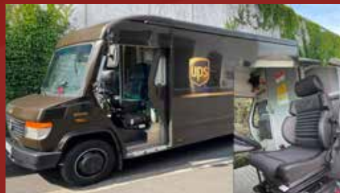
DB Vario UPS Deutschland