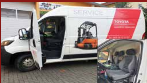
Peugeot BOXER Toyota Deutschland