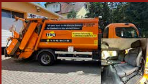
Fuso Canter Müllfahrzeug Beriebshof Gladbeck