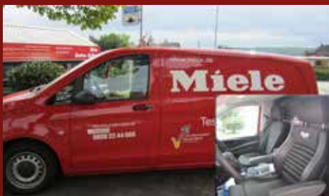
DB Vito Miele Deutschland