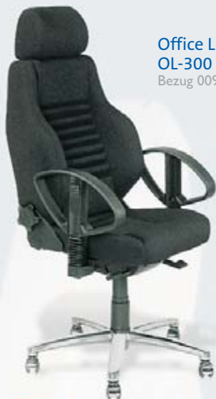
Office Line OL-300 FC-LA-A2 Bezug 009