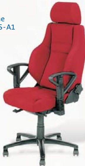
Office Line OL-300 FS-A1 Bezug 079