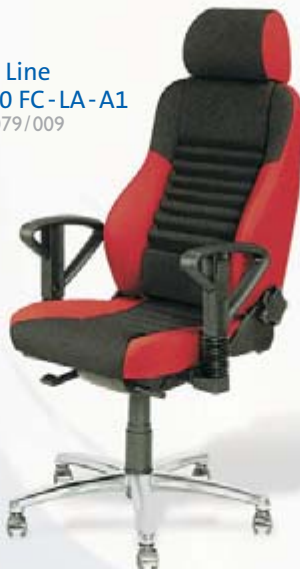
Office Line OL-210 FC-LA-A1 Bezug 079/009

Sie wünschen einen Sonderbezug? Zum Beispiel Velours oder exklusives Leder?