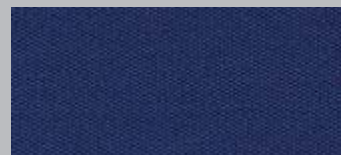
Außenteil Elegance blau EB 9460