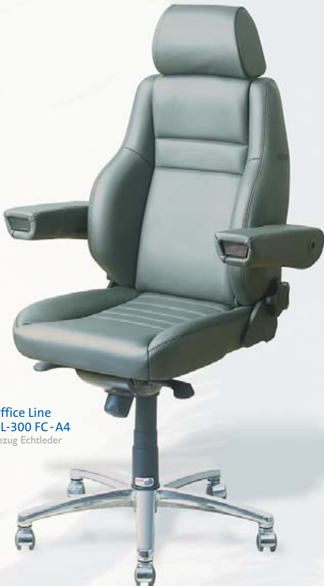
Office Line OL-300 FC-A4 Bezug Echtleder