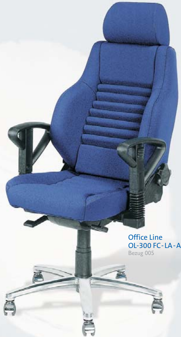
Office Line OL-300 FC-LA-A1 Bezug 005

Aktive Entlastung schafft täglich aktive Kapazitäten. Ein frisches Klima setzt neue Energien frei. Office Line OL-210 und Office Line OL-300 mit optionaler AKTIV-LAMELLE „LA“.