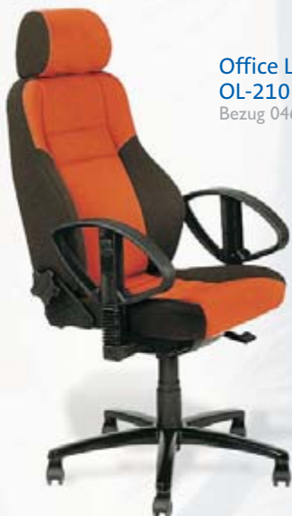
Office Line OL-210 FS-A2 Bezug 046/076