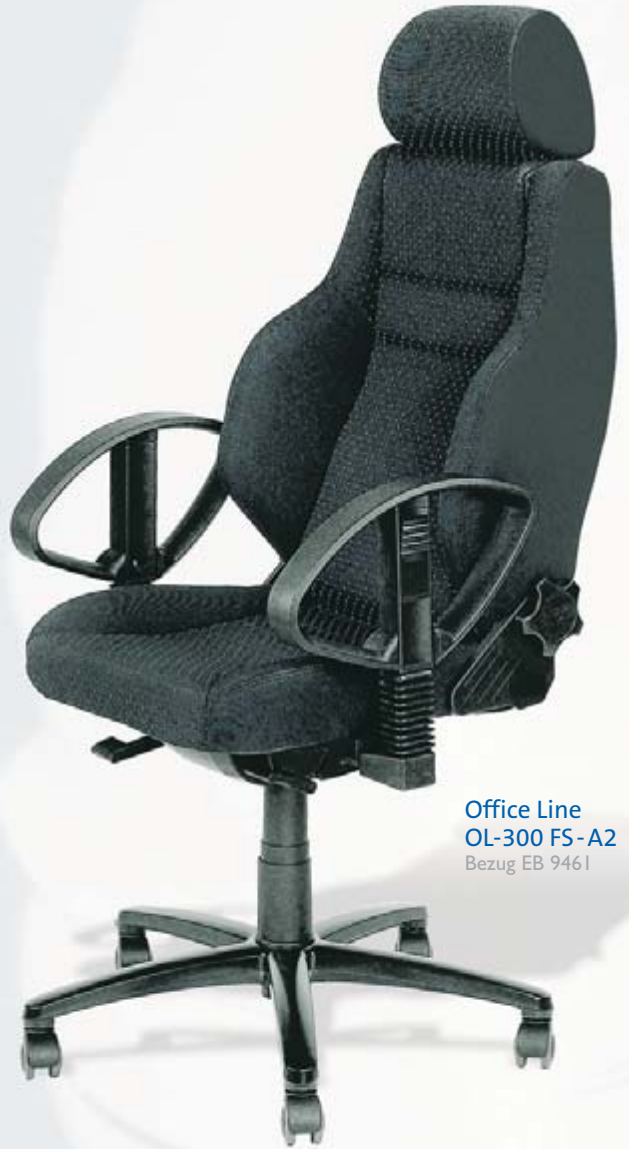
Office Line OL-300 FS-A2 Bezug EB 9461

Investieren Sie in den Firmensitz mit Potential für tragende Rollen: Die Entscheidungsträger mit Führungsqualitäten. Office Line OL-210 und Office Line OL-300.