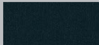
Außenteil Elegance schwarz EB 9461

Echtleder-Bezug rundum, schwarz Sonderausstattung Teilleder-Bezug, schwarz Sitz- und Rücken kissen Sonderausstattung