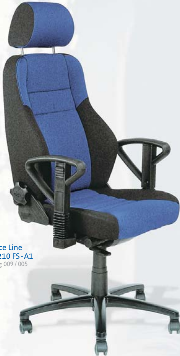
Office Line OL-210 FS-A1 Bezug 009 / 005