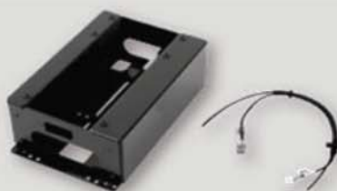
Konsole inkl. Car Kit